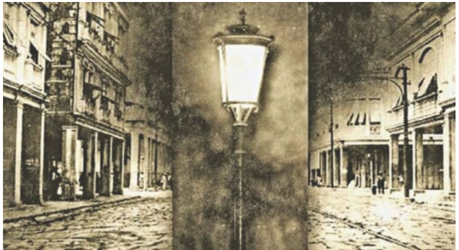
Alumbrados de calles en paris con lámparas de Aceites y gas. Fuente. https://hdnh.es/historia-origen-alumbrado-luz-ciudades/ Feliz casanova.

“Se Dice que Paris se convierte en la Ciudad de la luz debido a que los forasteros y extranjeros que durante el siglo XVII pasaban por la ciudad de Paris se maravillaban por la visión del primer alumbrado público del mundo, difundiendo la idea de una ciudad siempre iluminada. Pero sus luces no se debieron a una razón estética, sino a algo más prosaico, al parecer, el prefecto de la policía de Paris nombrado por Luis XIV, Gilbert Nicolás de la Reynie, ante la alta tasa de criminalidad callejera ordeno en 1667 colocar Lámparas de aceite y antorchas en puertas y ventanas para disuadir a los Malhechores”. Fuente. https://hdnh.es/historia-origen-alumbrado-luz-ciudades/ Feliz casanova.