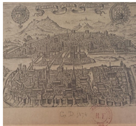
Representación de la ciudad de París en el año 1607, se aprecian los edificios de mayor importancia de la ciudad en la isla La Cite, como la catedral de Notre Dame.

La isla de la Cite se va convirtiendo en el corazón de la ciudad y en ella se desarrollan los edificios más importantes ya que poseía una protección militar natural que le proporcionaba las aguas del río Sena.