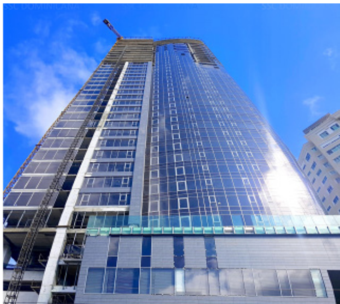
Fig. 1. Torre Anacona 27. Santo Domingo, Rep. Dominicana. http://sscdominicana.blogspot.com/2016/05/edificios-sostenibles-en-la-republica.html