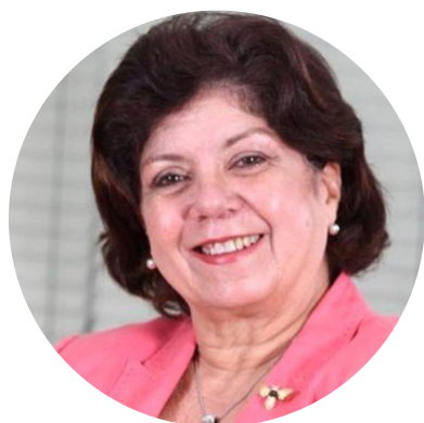
Por Mirian Díaz Santana, profesora de la Universidad Autónoma de Santo Domingo (UASD)

Desde sus inicios, la República Dominicana ha emprendido numerosas reformas de la educación. Cada una de ellas ha sido el producto de diferentes intentos de modernización, impulsados por grupos que aspiran a lograr avances económicos y sociales.