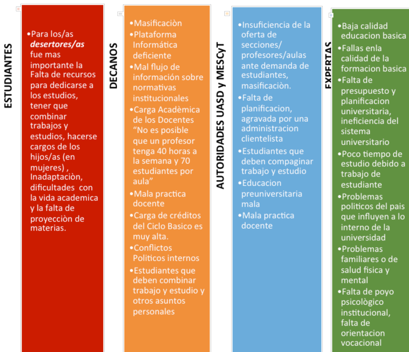
Figura 2. Causas de la deserción según los actores consultados