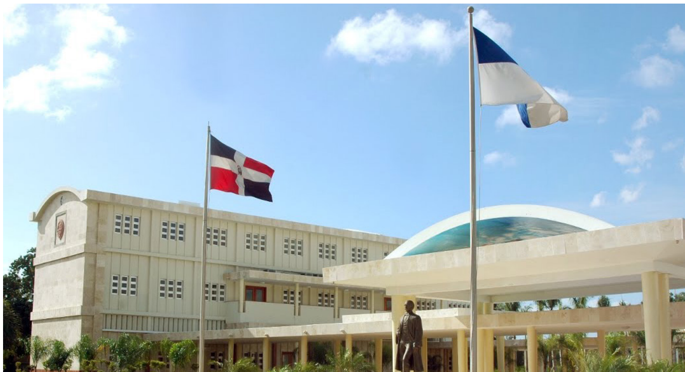
Explanada vieja rectoría de la Universidad Autónoma de Santo Domingo (UASD).