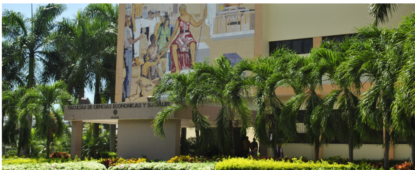
Facultad de Ciencias Económicas y Sociales, Sede Universidad Autónoma de Santo Domingo.

La tasa de informalidad experimenta su mayor reducción en promedio 2 puntos porcentuales en el periodo de auge económico 2013-2016 y en el de recuperación postpandémico 2022-2023, y en 2009-2012, y los años de mayor crecimiento son en los dos años de pandemia 2020-2021 (2,8 %) y en el periodo de expansión económica 2005-2008 (1,4 puntos porcentuales).